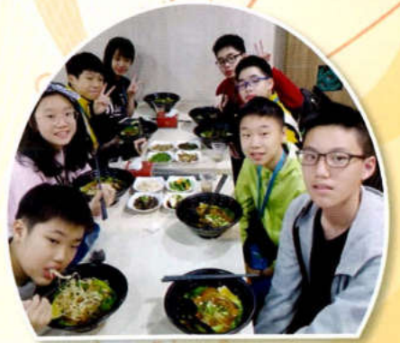
特別愛心服務 - 6A 男同學