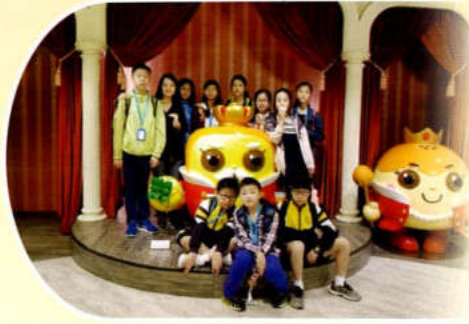
表現出色組 - 第二組