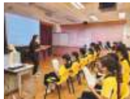
LSCD Musical Drama Team