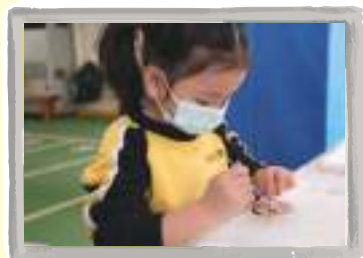
學生製作陀螺 - 學習科學原理