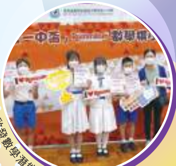
發掘數學潛能，參與魔力橋邀請賽