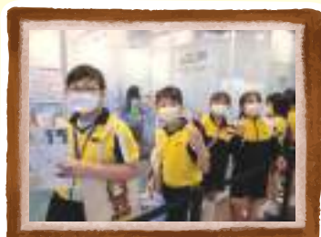
同學參觀創新科技嘉年華 InnoCarnival2022