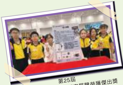
第25屆 常識百搭小學STEM探究展覽榮獲傑出獎

打破科目領域的間隔，發展學生的知識、技能及綜合資料的能力，鼓勵學生思考，積極探究、分析資料及學習小組匯報技巧，靈活運用學科知識解決生活問題。