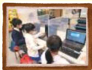
Unity遊戲製作拔尖班 - 同學努力製作3D迷宮遊戲