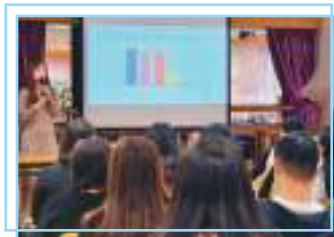
家長講座 - 如何預防及處理兒童及青少年的網絡行為問題