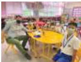
Our Kid Scientists