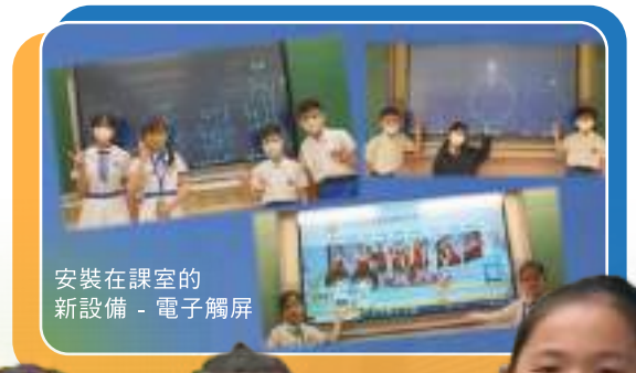
安裝在課室的 新設備 - 電子觸屏