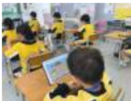
Elearning in GE Lessons