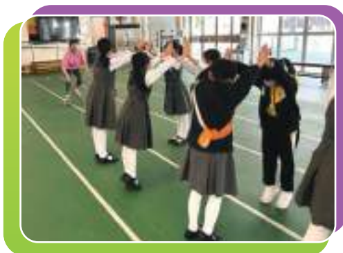
前速度溜冰運動員與三年級學生分享運動員經歷