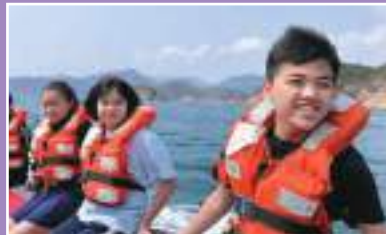
乘風航活動，考驗勇氣