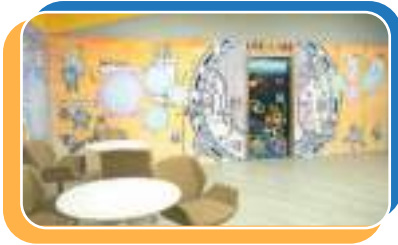
一樓大堂 更多的學習空間