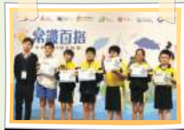
第25屆常識百搭小學STEM探究展覽 榮獲傑出獎及25週年大獎