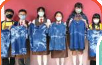
紮染工作坊學生製成品