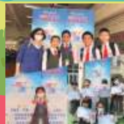
參賽同學們信心十足