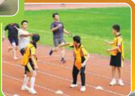
阿仔阿女交俾你地啦!