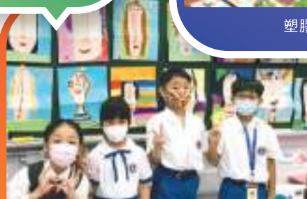
課堂剪影：「瘦瘦長長的臉」