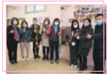
家教會贊助安裝自動感應連UV常溫飲水機