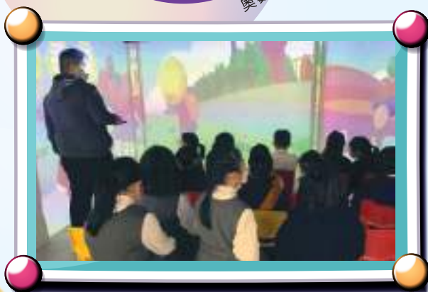
嘩！270度閱讀數學繪本！