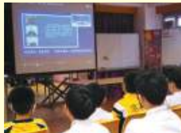
師生一同參與南京大屠殺85周年 學生悼念活動