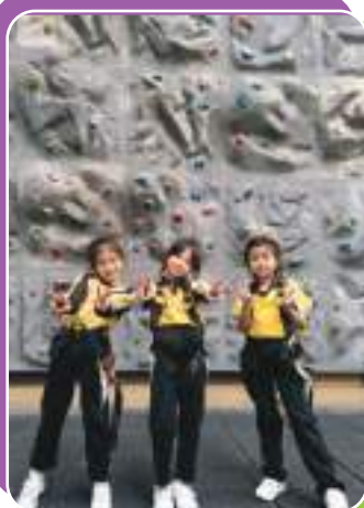
攀石活動後，同學開心合照