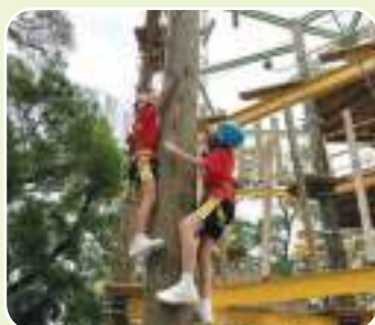
(成長的天空) 有同學伴我同行， 多高也不怕