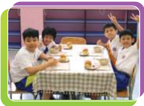
餐桌禮儀課 - 同學開心地用餐