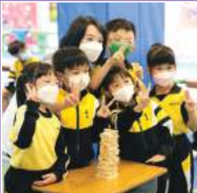
正向教育日 合作展成果