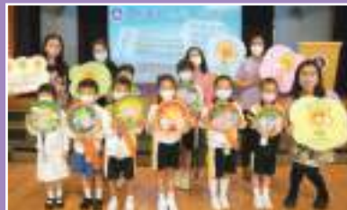
禮恩行動承諾啟動禮