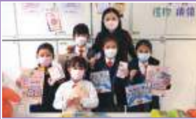
禮恩行動承諾。儲簽名，換禮物

學校致力培養學生有良好品德，建立正面價值觀。本年度推行「禮恩行動承諾」，以家校合作的理念，在不同階段定立目標，讓學生認識及發展不同性格強項及培養良好品德。另外，每月更定立不同主題的「禮恩CEO」，被推選的CEO更可與校長有個約會，表達對學校活動的建議。而本校更舉行「正向教育日」、「人人有利事」等活動，培養學生關愛別人、關心社區。