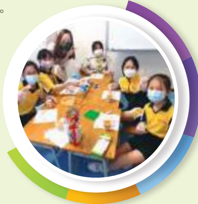
(女生約會) 好朋友們一起製作乳酪杯， 一邊品嚐一邊聊天，促進友誼