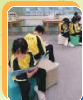
同學喜歡一起坐在悠閒區閱書