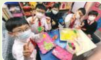
(關愛遊戲基地) 珍惜快樂的時光， 彼此分享心愛的玩具