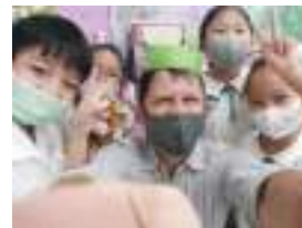
English Acers having fun!