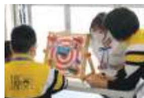
Phonics Game Booths