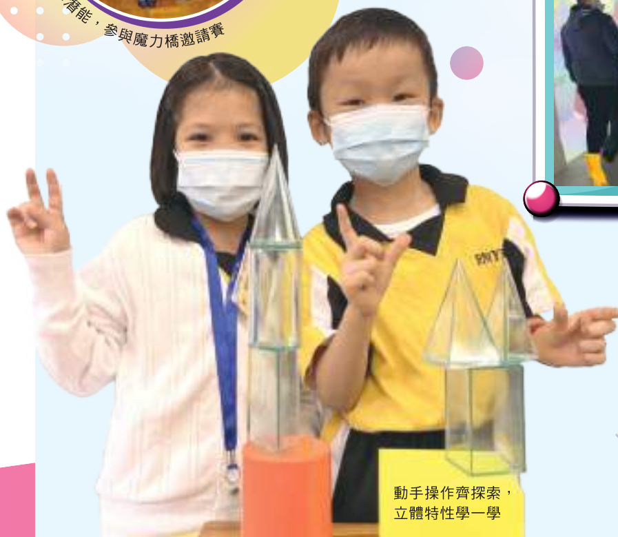
動手操作齊探索， 立體特性學一學