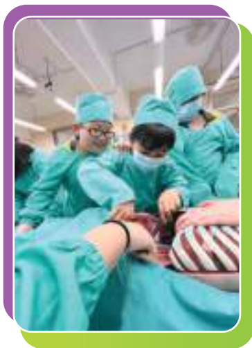
我都可以成為外科醫生

本校更於本學年推行生涯規劃，舉辦不同的講座、模擬人生工作坊及不同的職業體驗，讓學生透過活動，藉此培養學生計劃未來，亦培養他們的職業意識和理解能力。