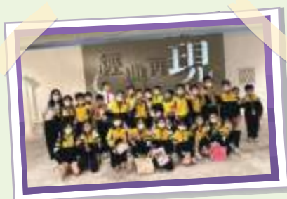
跳出框框 齊來認識香港歷史文化