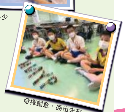
發揮創意，砌出未來