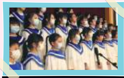
詩班以動聽的歌聲獻詩