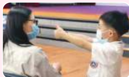
營造親子讚賞文化