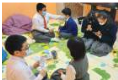
禱告小天使彼此學習禱告仰望主