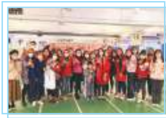
家長義工 - 中華文化日