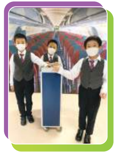
小小空中服務員準備為大家服務