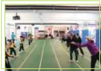
童喜動趣味親子活動