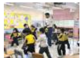
Playing with NETs