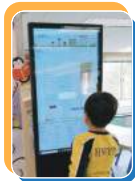
用直立觸控式電腦閱讀圖書，好開心！