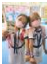
Welcoming P.1 Kids

The school highly values the importance of positive classroom language and learning environment. Students are immersed in an encouraging and loving language environment.