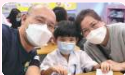
被讚賞和愛包圍的孩子總是笑意滿滿