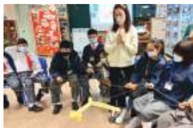
禧恩團契 - 同心協力，任務達成