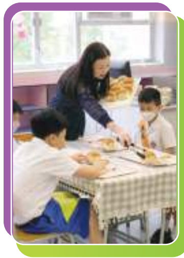
餐桌禮儀課 - 校長為學生送上面包