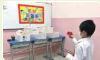
(考試能量場) 訂立考試目標， 尋找有效方法努力達成