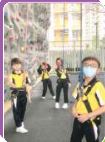
二年級同學攀石初體驗 同學們表現興奮