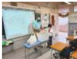
English GS Lesson