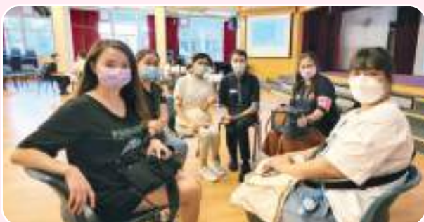
九月關顧小一家長適應小組

升上小學是成長的新階段，學校為小一家長在學期初多次安排家長會及家長小組，讓家長更了解孩子的適應情況。在十月的家長會，不單老師們讚賞孩子們的努力付出，更邀請家長於課室中公開欣賞，嘉許孩子的適應和成長。