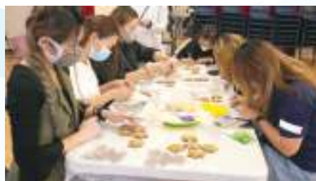
為至愛，用心做，合家心花放