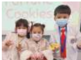
Making Paper Fortune Cookies for Family