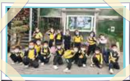
香港動植物公園認識動植物