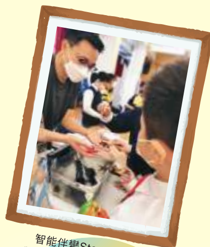
智能伴變Stem Day - 學生接觸不同的海洋生物