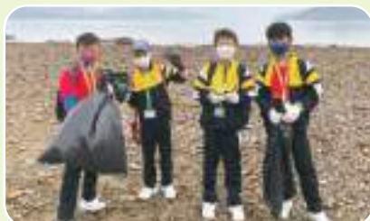
(成長的天空) 清潔沙灘垃圾， 服務社會