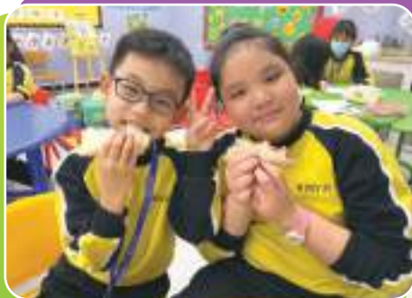
同學們很享受自己製作的食物