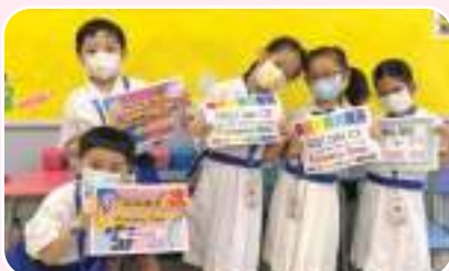
九月一日愉快開學