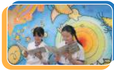
看圖書的好地方 - 禧恩圖書館