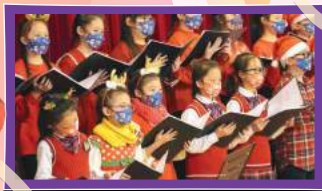
聖誕節時 合唱團以悅耳的歌聲 為大家送上祝福