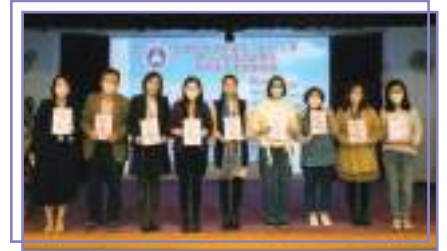
第十七屆執行委員就職禮

為了加強家長與學校間的聯繫，家教會亦會舉辦不同的講座課程、親子活動、家長茶座、親子旅行和哈拿家庭小組等。我們注重學生教育同時，也關注家長的內心感想。