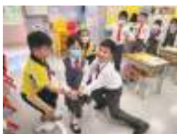
London Bridge is falling down!