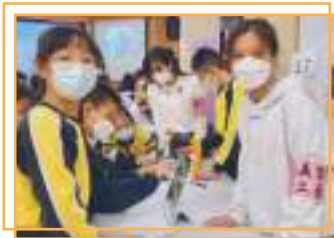
家長義工 - STEMDAY