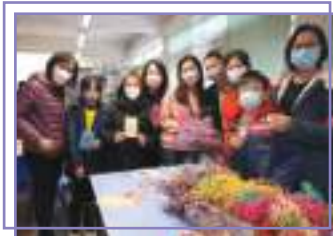
禧恩同樂日攤位遊戲 - 花之祝福