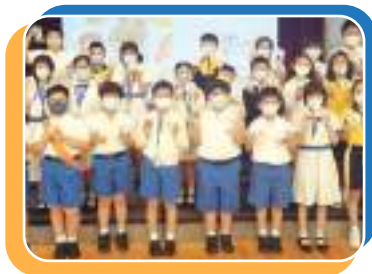
同學想做麵包師傅嗎？