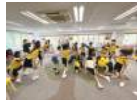
In-school Musical Drama Team