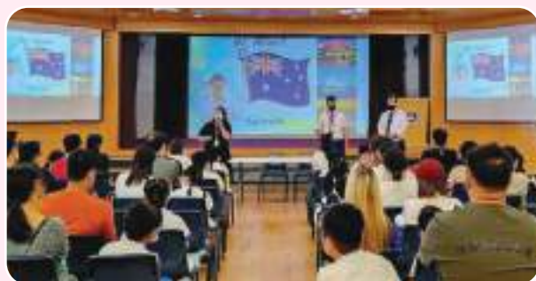
八月小一新生家長會