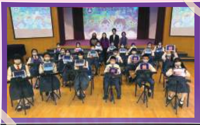
E樂團接受訪問及拍攝