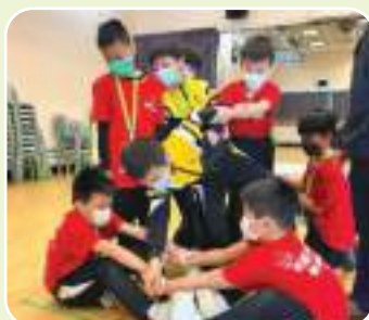
(成長的天空) 考驗對組員的信任， 互相幫助下完成任務