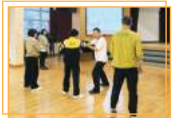
親子太極拳體驗中國文化活動