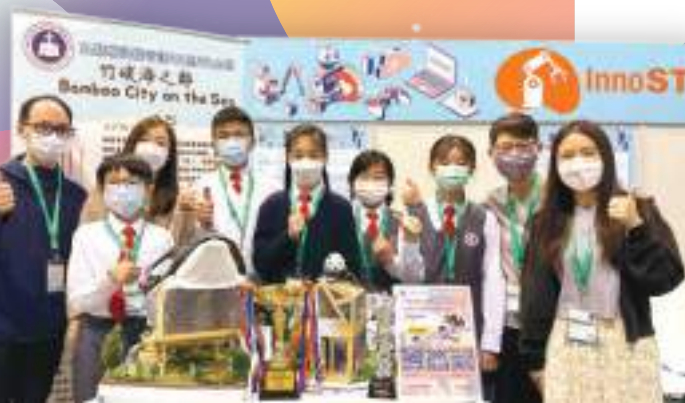
學與教博覽2022-展示優秀作品「竹碳海之都」