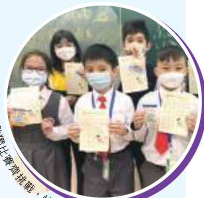
數學比賽齊挑戰，快而準，真厲害！