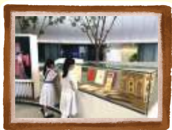
參觀戲曲中心 - 同學細心欣賞不同的戲曲展品