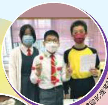
我們是立體圖形建築師！