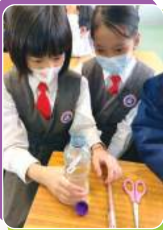
我們的小小科學家