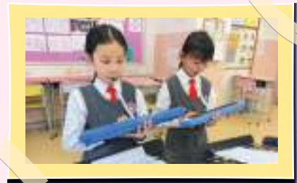
同學開心地吹奏口風琴