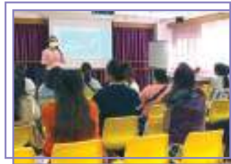
家長課程 - 正向教育的實踐