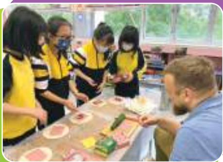
不一樣的英語課堂 - 手卷製作初體驗