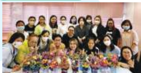
祝福大家生命如花之燦爛