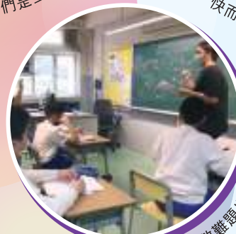
奧數難題也難不倒我們