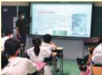
我國的大英雄岳飛