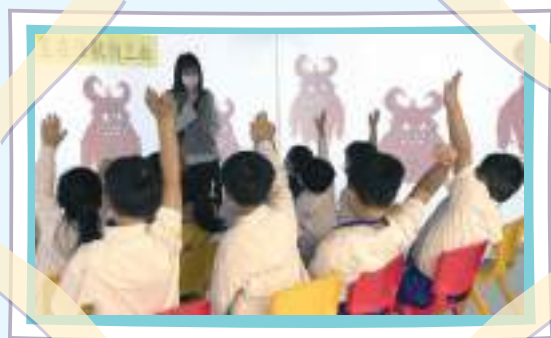
在互動課室上數學堂真有趣