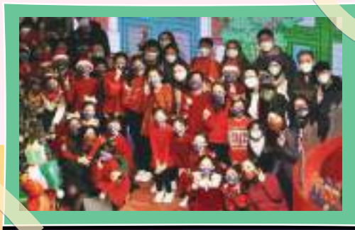
合唱團到海港城作慈善表演