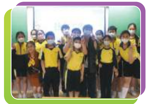
社工系的師兄回校與師弟妹分享初為社工的心路歷程