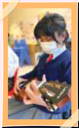
同學用心地準備ukulele比賽