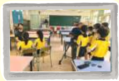
小導演大製作 - 學生用心拍攝老師訪問