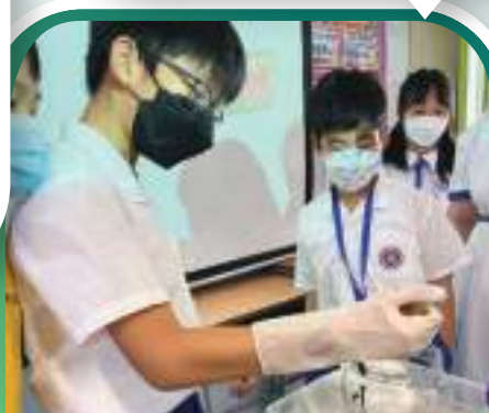
學生在扎染工作坊參與製作藍染物料