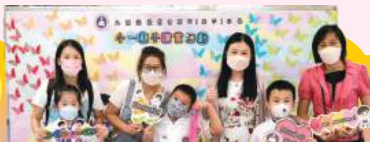
小一親子讚賞活動