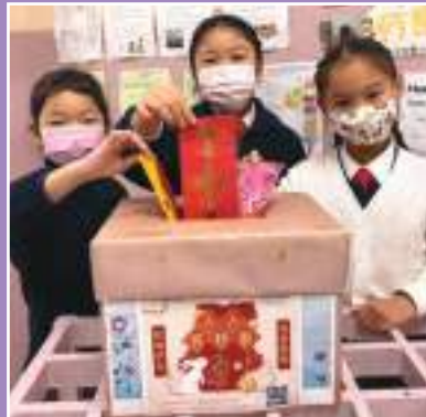
「人人有利事」捐款活動