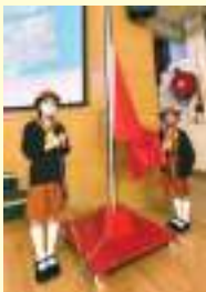
女童軍專責 周一的升旗禮

學校在30/9/2022舉辦了國情教育日，讓學生認識國旗、國徽、國歌的緣起及意義。透過繪本閱讀，認識國家的航天發展；並閱讀電子展板，學習民族英雄的事蹟，提升了對國民身份的認同。此外，五、六年級的師生共同參與「南京大屠殺85周年學生悼念活動」，學生不但銘記這段歷史，並一同默哀、悼念。