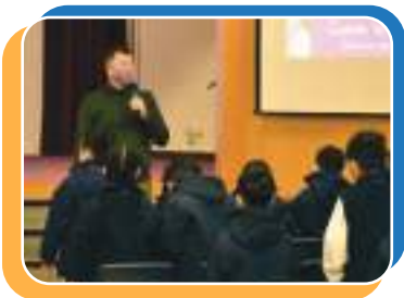
外籍老師也來推介圖書

「閱讀」能發掘知識的寶藏，孩童透過閱讀可以「穿越時空」，把眼光擴大，嘗試接觸課外書上另一片的天空。因此，我校常舉辦有關閱讀的活動和比賽，例如好書介紹分享會，每次由老師介紹有益並值得一看的書籍予同學閱讀；跨科閱讀獎勵計劃，鼓勵同學多閱課外書；舉辦書展和閱讀日，邀請作家到校和同學分享閱讀的樂趣。「禧恩圖書館」於本學年十一月完成裝修。館內設置三部直立觸控式電腦，學生可於小息時善用它們來上網閱讀資訊和電子圖書，也可以瀏覽教育學習網站。同學懷著開心、自由、自主的心情坐在舒適的椅子上閱讀心愛的圖書。此外，圖書館增設一個悠閒區，區內的地毯上織出一棵大樹 - 大樹包含著栽培與茁壯成長的意義，又謂「十年樹木，百年樹人」，它提醒我們：教育是百年大計，不可忽視。禧恩圖書館，培養同學閱讀文化，與時並進跨未來！