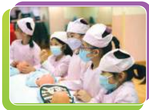
小小育嬰護士細心聆聽教學