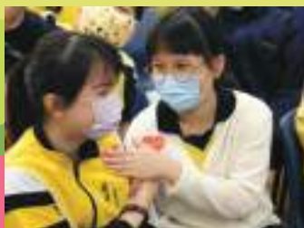
彼此祝福：耶穌愛您