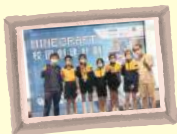
科學競賽 - Minecraft校園創建計劃

參加科學展覽、科學競賽和科學研究項目等，培養學生科學研究、分析和解決問題的能力。