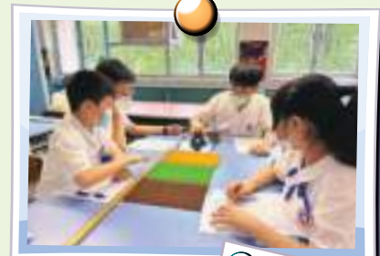
動手做斜板知多少