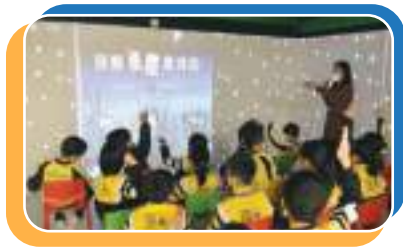
同學一起在夜空下閱讀故事書