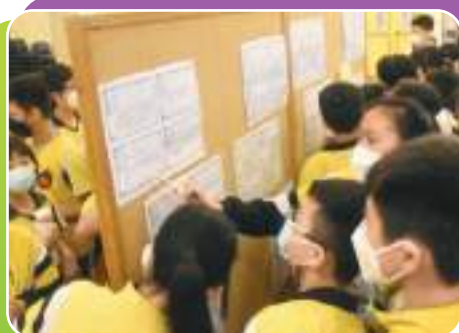
六年級同學求職初體驗